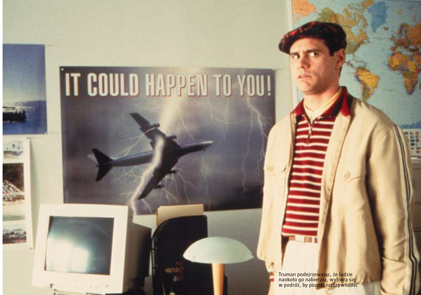
Truman podejrzewając, że ludzie naokoło go nabierają, wybiera się w podróż, by poznać rzeczywistość

Jednak Truman zaczyna coś podejrzewać, drobne wpadki aktorów i producentów naprowadzają bohatera na trop prawdy. Postanawia wybrać się w podróż na Fidżi i spotkać z Lauren, która wydaje mu się jedyną osobą na świecie godną zaufania. Charteruje łódź i wypływa. Reżyser sprowadza na